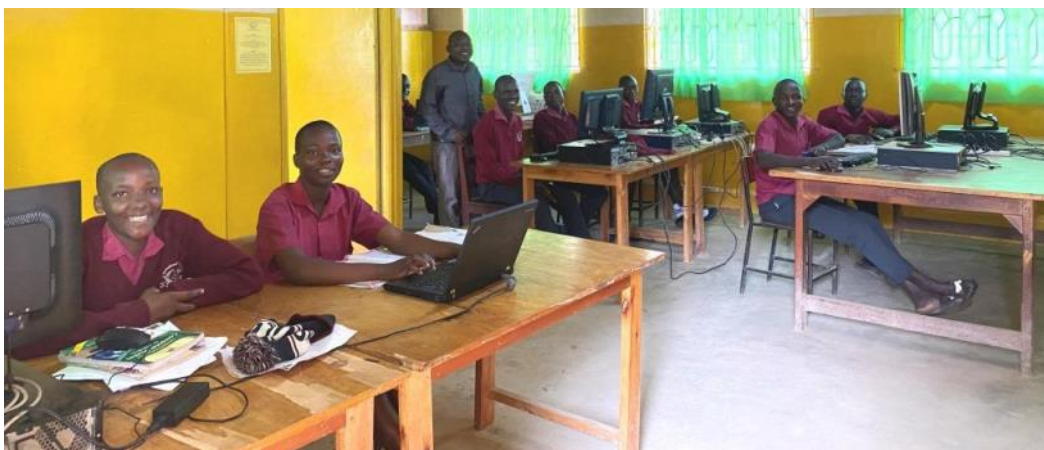
Ci-dessus: Étudiants révisant pour les examens.

À l'IVS, nous restons fermes dans notre mission de fournir une éducation de qualité tout en nous adaptant aux évolutions du système éducatif au Kenya. Comme toujours, nous exprimons notre profonde gratitude à nos sponsors pour leur soutien en ces moments clés. Ensemble, nous contribuons à bâtir un avenir brillant pour nos élèves.